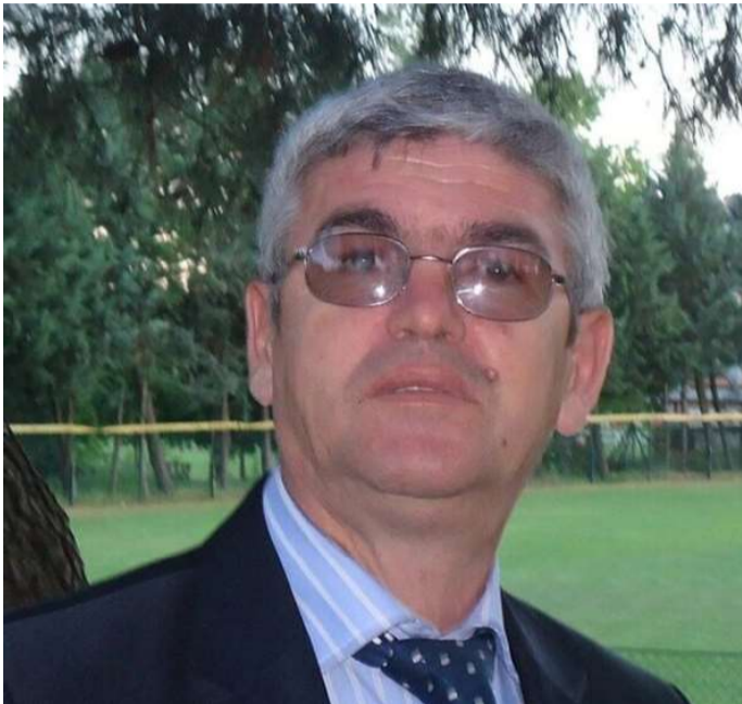
Nga Sakip CAMI

M bas viteve 90 pati një sulm neveritës deri edhe duke u vënë kazmën lapidarëve dhe memorialëve të LANÇ dhe të luftërave për liri dhe pavarësi të popullit shqiptar. Sulmi fizik u shoqërua me një fushatë histerike mediatike kundër të kaluarës së shqiptarëve, veçanërisht ndaj luftës antifashiste e antinaziste. Shqipëria u rendit në krahun e fitimtarëve të Luftës së dytë botërore, përkrah anglo-amerikanëve dhe Bashkimit Sovjetik dhe kjo renditje jo vetëm nuk vlerësohet nga disa politikanë e historianë servilë të politikës, por përkundrazi errësohet kjo periudhë.