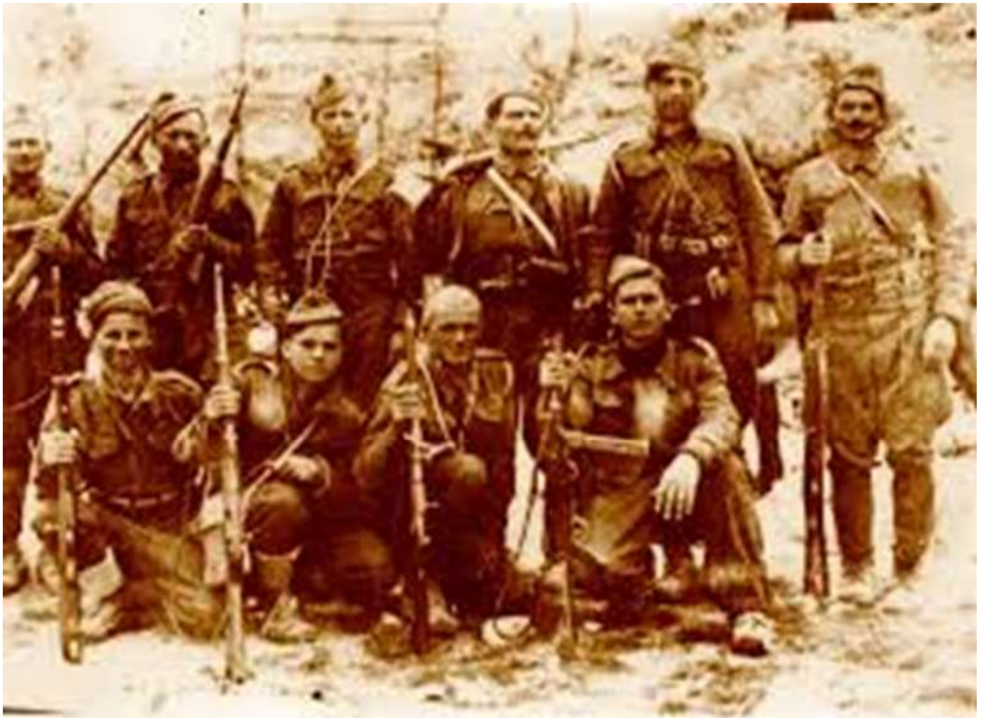
1944 u arrit që të formohen edhe dy batalione me luftëtarë dhe kuadro. Megjithë vështirësitë e

Në periudhën nga 28.11.1943 deri më 20 janar