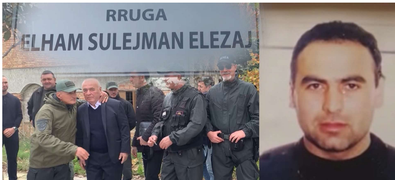
(Vijon nga faqja 11)

Ai kreu me sukses shërbimin e detyrueshëm ushtarak/ policor dhe më tej shërbeu edhe si shofer aktiv edhe në shërbime. Miqtë e tij të ngushtë e kujtojnë për veprimin energjik në digaster, edhe ditën që u sulmua godina e klubit të këtij dikasteri, më 29.5.1991, kur me guxim diti të përballonte valën e demonstruesve, si dhe të bëhej mburojë të pronës shtetërore përballë atyre që kërkonin të shkatërronin objektin duke i vënë flakën. Një vit më vonë në nëntor 1992 u pranua në repartin nr.88, caktuar “shofer trupe operacionale”, ka qenë pjesëtar në shumë operacione me shkallë të lartë vështirësie, ndër të cilët përmendim, ndërhyrjet e tyre në Valbonë, Korçë, Vlorë, Shkodër dhe në të gjithë Shqipërinë. Më tej u caktua duke u përzgjedhur edhe në grupin e sigurimit të ministrit të Brendshëm.