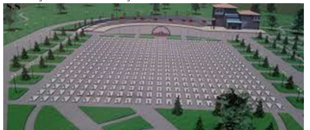
Varret e viktimave të masakrës në Meje

Për vrasjen e 376 shqiptarëve të pafajshëm në Meje nuk u dënuan të gjithë kriminelët serbë. Kriminelët nuk u dënuan as edhe për masakrat tjera të kryera dhe të dëshmuara me faktografi. Ndaj, organe e Kosovës, sa më pare dhe me ngulm, duhet të kërkojnë që fajtorët, për krimet e bëra të ndiqen dhe ndëshkohen.