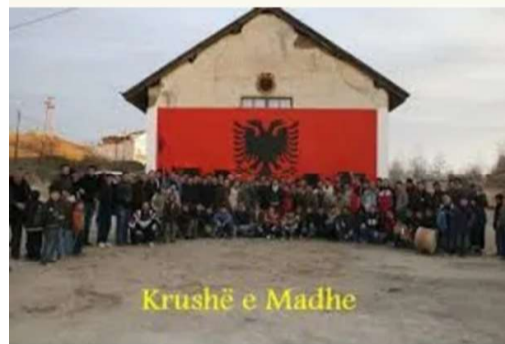
Krushë e Madhe

Rreth 1600 persona konsiderohen ende të zhdukur gjatë luftës në Kosovë. Ndonëse çështja e hapjes së arkivave për të pagjeturit është ngritur në kuadër të dialogut midis Kosovës dhe Serbisë për normalizimin e marrëdhënieve, ende nuk ka lëvizje që do të sjell shpresë të re. Nëse Serbia do t'i hapte ato arkiva, do të duhej të përballej me faktin se është përgjegjëse për shumë krime që kanë ndodhur në Kosovë dhe në trojet tjera të ish Jugosllavisë nën ombrellën e ushtrisë, policisë dhe paramilitarëve të tyre