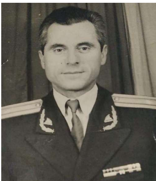
(Vijon nga faqja 6)

ishtë bëri të mundur që kjo kooperativë të kishte rezultate të larta në prodhim dhe të zinte vend të parë në gjithë rrethin e Matit.